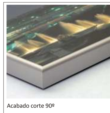
Acabado corte 90°