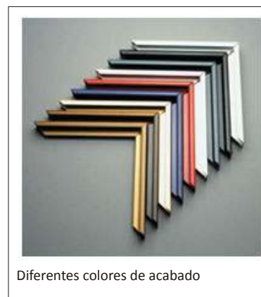
Diferentes colores de acabado