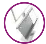
Portarevistas o portafolletos